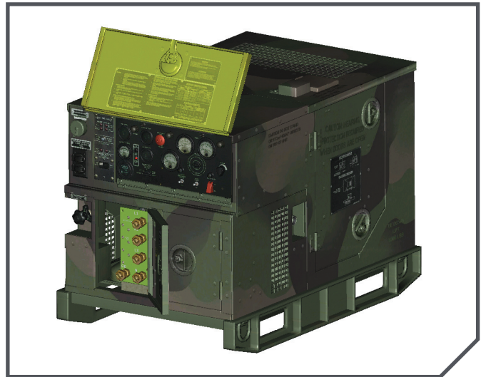
La simulation NGRAIN s'est traduite en un taux de succès de 100%

L'équipement virtuel peut être visionné en détail et sous différents angles. L'utilisateur peut voir une vue en coupe de la génératrice et examiner les pièces en contexte afin de mieux comprendre ce système complexe. Intégrée directement dans le plan de formation, la nature interactive du VTT permet aux étudiants de librement retirer ou poser des pièces, de s'entraîner sur des procédures, de développer des compétences cognitives critiques pour la localisation de dysfonctionnements et le dépannage, et de mettre en pratique l'information acquise dans un environnement physique. La technologie NGRAIN présente des exercices de dépannage qui aident les étudiants à développer des compétences cognitives qui se transposent facilement dans leur travail sur le terrain.